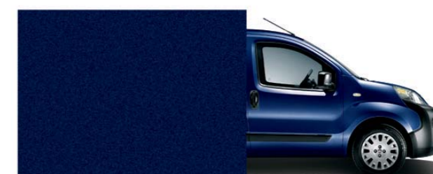
487 Bleu foncé