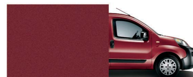
293 Rouge foncé