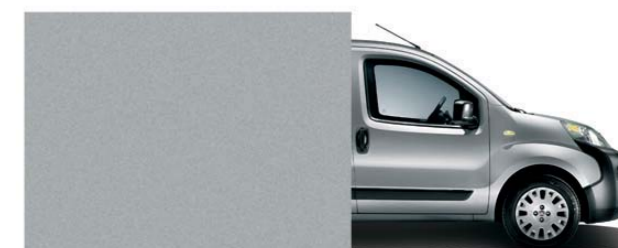
612 Gris clair