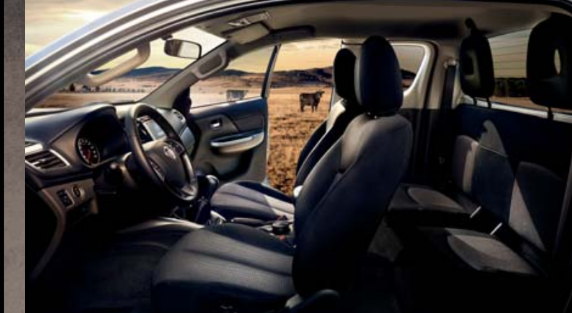
CABINE APPROFONDIE AVEC SELLERIE TISSU.