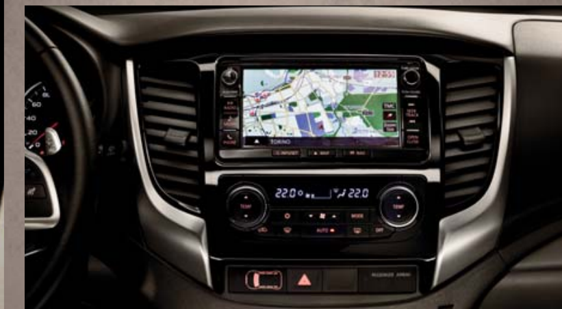
ECRAN TACTILE AVEC SYSTEME DE NAVIGATION.