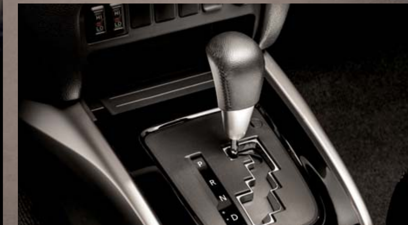
BOITE DE VITESSES AUTOMATIQUE.