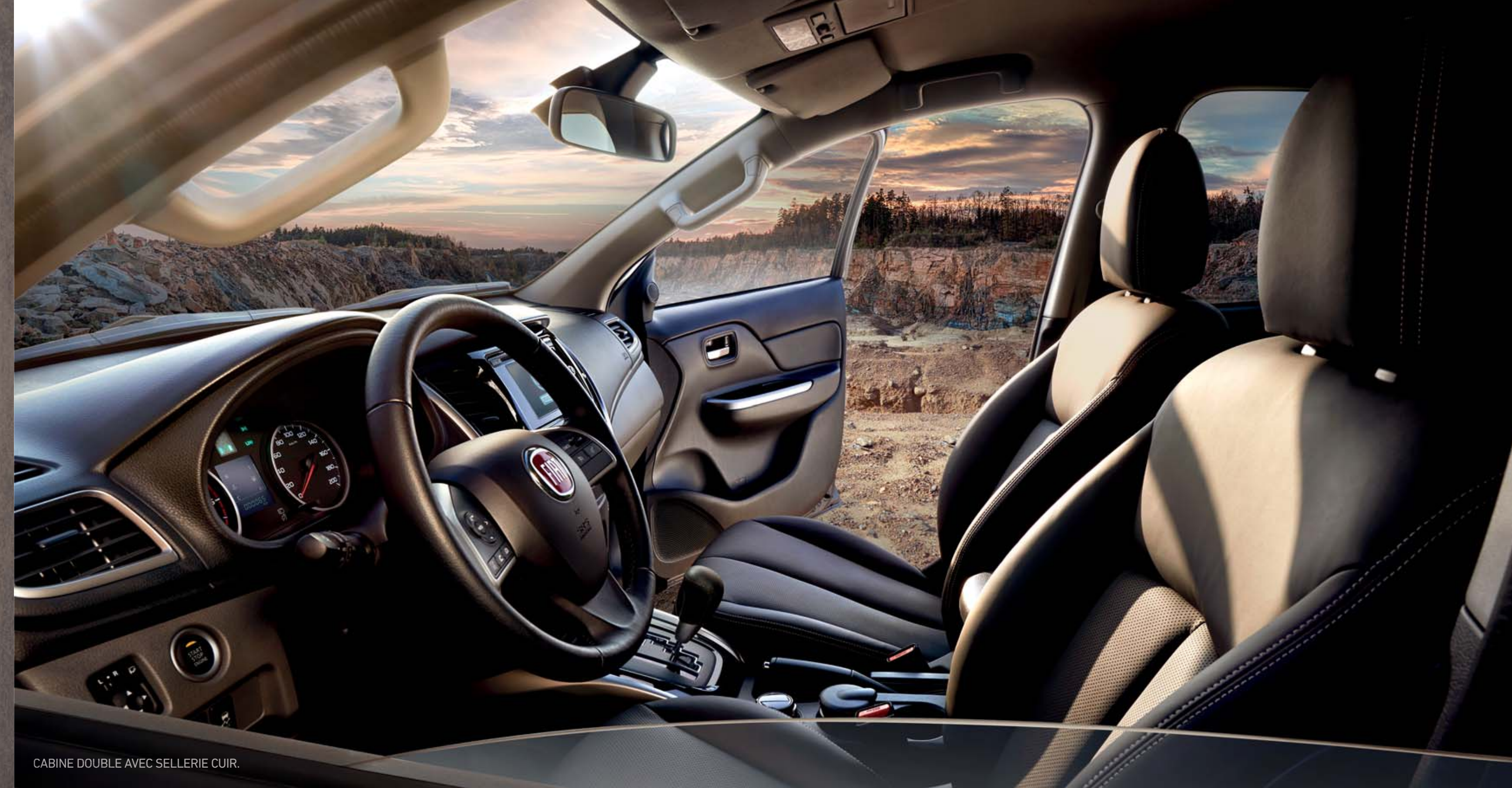
CABINE DOUBLE AVEC SELLERIE CUIR.

Proposant une offre complète d'infodivertissement comme L'ECRAN TACTILE MULTIFONCTION avec NAVIGATION, BLUETOOTH®, CAMERA DE RECUL... Le Nouveau Fullback est parfait pour rester connecté à votre style de vie et à votre travail.